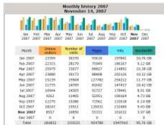
FIGURA 2. Informe d'accessos ( awstats ).